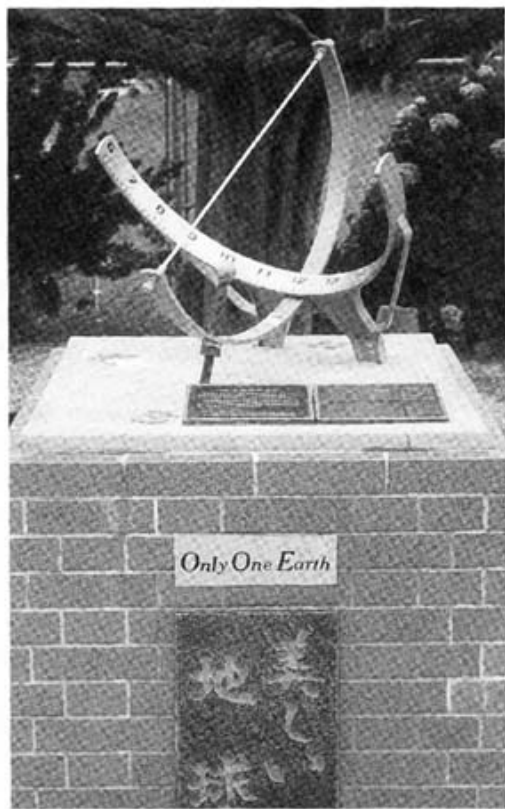
愛華ちゃんが通った小学校に出来た記念碑

これからは若い皆さんが社会を良くして行く時代なんだ、だから注意をするんだ。」こう若い人に言ってるんです。