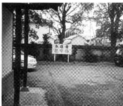
境内にある駐車場

花岳寺内赤穂学林では坐禅会、原始仏教講座、古文書会、童話会、写経会等何方でも、何時でも門を開いて入会をお待ちしております。