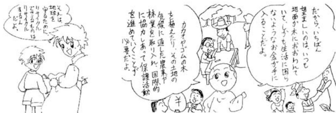
愛華ちゃんが描いた「地球の秘密」