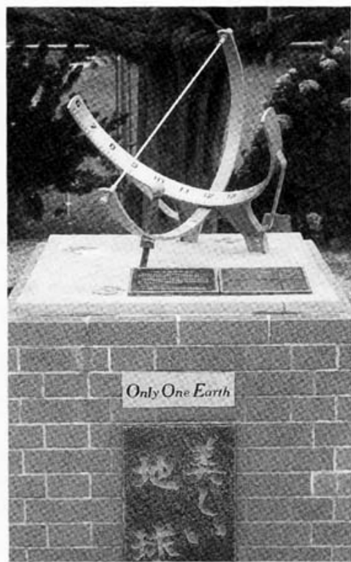
愛華ちゃんを通った小学校に出来た記念碑

「その政治が悪いのは○○党が悪いから。」と書いてありました。次に、「○○党が悪いのは一人一人が悪い