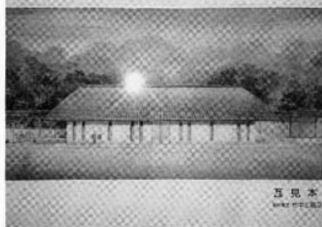
新義士館完成予想図

平成一四年は赤穂の義士の三百回 忌法要が営まれる。泉岳寺ではこの 赤穂の義士の功績を末代に伝えるた めに、「新義士会館」の建立を計画 している。