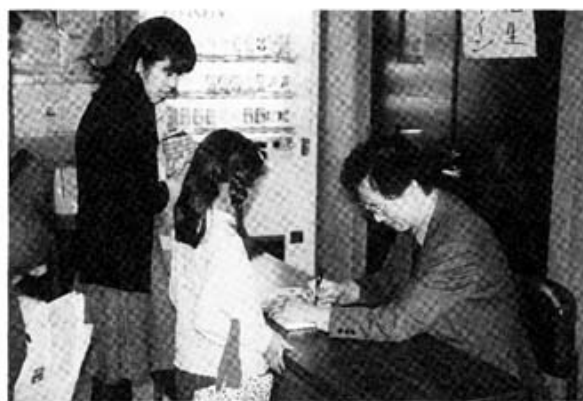
(平成十年度中曹青山口大会より)

そして私達文明人は、開発途上国 の人達の生活の一〇倍も一〇〇倍も の贅沢をしております。エネルギー も昔の人達の一〇〇倍ものエネルギ ーを消費しております。このまま地 球の環境破壊が進みますと、二〇年 後三〇年後の世界はどのような世界 が待っているのでしょうか。このま までは私達の子供達、孫達に美しい 地球を伝えることが出来ないような 状況です。