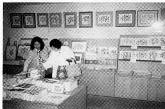
相田みつを美術館内の売店