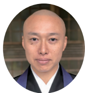
●執筆者プロフィール 磯江紹一元

毎月最終日曜日二一時より開催しております。一般の方のもとより、僧侶の皆さまのご参加もお待ちしております。