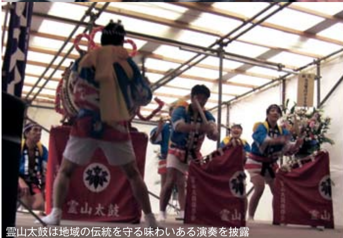
霊山太鼓は地域の伝統を守る味わいある演奏を披露