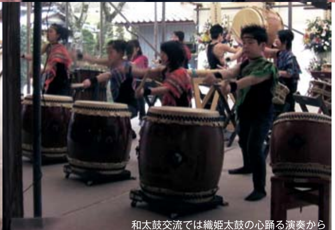
和太鼓交流では織姫太鼓の心躍る演奏から