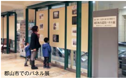
郡山市でのパネル展