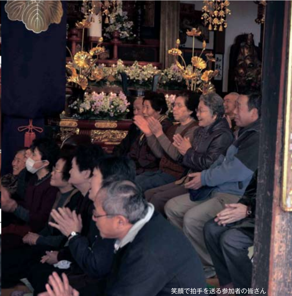
笑顔で拍手を送る参加者の皆さん