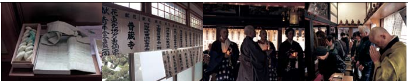
※法要の様子は USTREAM の録画画像にてご覧いただけます。http://www.ustream.tv/recorded/21027205

全日仏青会員、全曹青会員による宗派を超えた荘厳な法要となった本行事には約200名が参列。全曹青としては初めての試みとなった USTREAM によるインターネット中継を、のべ約350名の方が閲覧するなど、時間、空間、宗派を超え、心一つに祈りを捧げる機会となった。