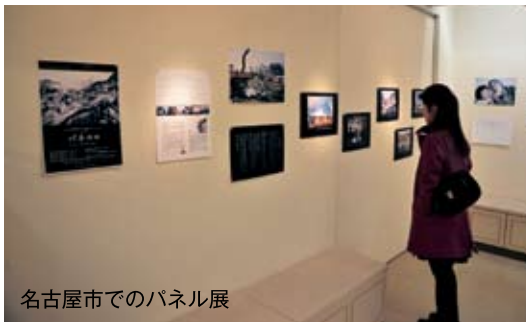
名古屋市でのパネル展

平 成23年度・禅文化学林の開催に合わせ、東日本大震災の発生から今日に至るまでの全曹青会員の活動を総括したパネル展『巡る、悼み。』大震災に縁り添う僧侶たち』が開催されました。加盟団体などにも画像提供を頂き、作成された全33枚のパネルは、フォトジャーナリストの國森康弘氏の監修によって、それぞれ「畏れと悼み」（発災直後）、「縁り添う」（緊急支援期）、「念じ立つ」（生活自立支援期）、「生破