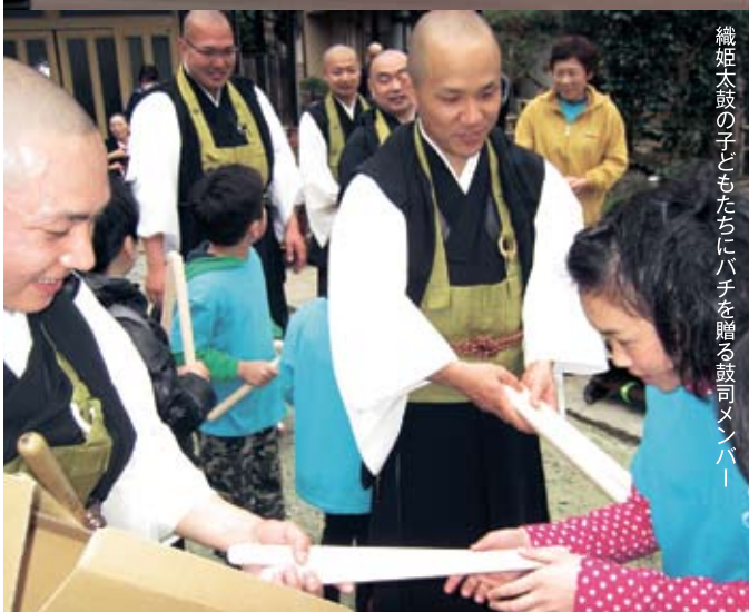
織姫太鼓の子どもたちにハチを贈る鼓司メンバー