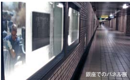
銀座でのパネル展