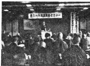
絵のこもった教養セミナー

「青島村青年連盟教養セミナー」は、青島村青年連盟の青年たちが、この夏、北海道第1回地方集会に参加し、力強く第一歩を記す。