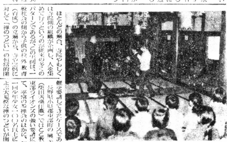
写真は子供連のつどい開会式

ライオンズクラブが主催する「子供連のつどい」は、長野県東部町で開催された。このつどいには、ライオンズクラブのメンバーと子供連のメンバーが参加し、楽しい時間を過ごした。