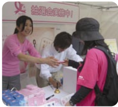
スマイルウォーク2009(東京)の様子

住友生命は乳がんの早期発見、早期治療、早期治療の大切さを伝えるピンクリボン運動を応援しています。このピンクリボンマークは、ピンクリボン・フェスティバル（日本乳がん協会と宝島）のマークです。