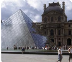
Pyramide du Louvre arch.I.M.Pei

子どもたちの夢を育み心豊かな成長を願って昭和52年度にスタートしました。優秀作品102点はルーヴル美術館に1ヶ月間展示されます。配付画用紙1枚につき1円、応募作品1点につき10円をユニセフに寄付しています。