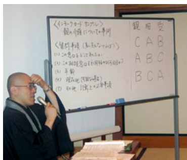
記録用紙を用いたロールプレイの説明