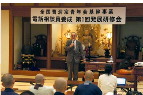
穂積先生は僧侶への期待もお話しされた