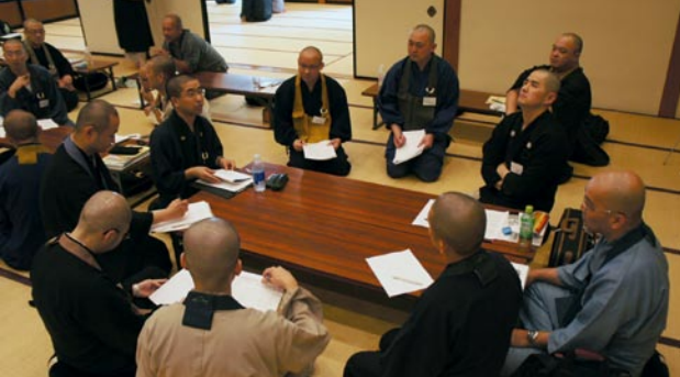
トラブルケースについて参加者同士で話し合う