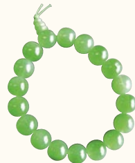
子ども用腕輪念珠